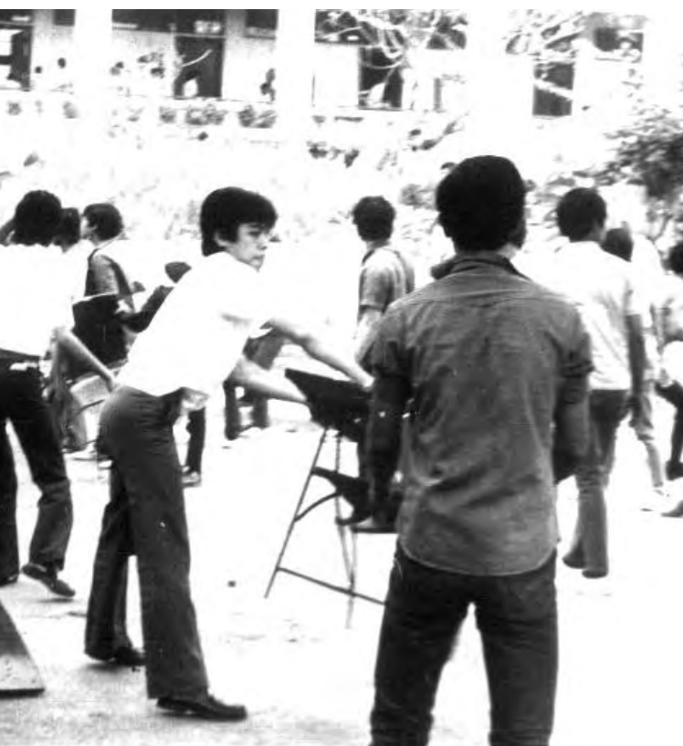
Ilagan sa harap ng AS steps