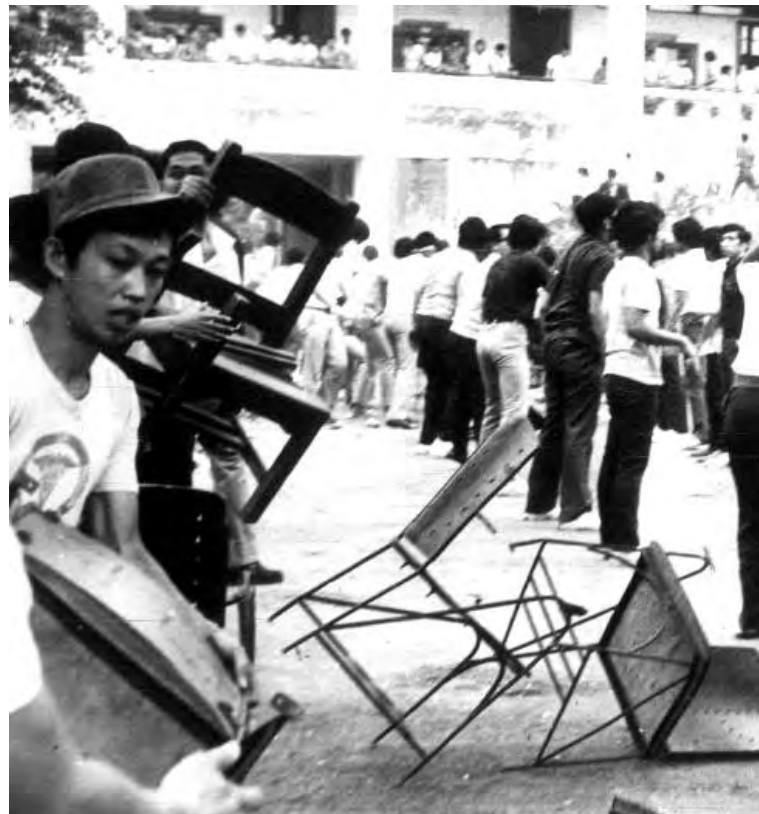
Mga communards sa Palma Hall na pinapasa ang mga silya upang gamiting barikada

Naroon din ang mga fakulti na malikhaing gumawa ng mga armas pananggalang tulad ng self-igniting Molotov bombs at mga kwitis; at ang mga kababaihang estudyante na karamihan ay unang naranasan “ang karahasan ng estado sa pagsalakay sa kampus at sa mga dorm” na tumalikod sa mga dating pananaw sa kanila bilang “pangdekorasyon sa mga tradisyonal na aktibidad ng UP tulad ng Cadena de Amor at Lantern Parade.” Sila ay nagkapit-bisig kasama ang mga kalalakihan at naging communards na handang idepensa ang unibersidad.