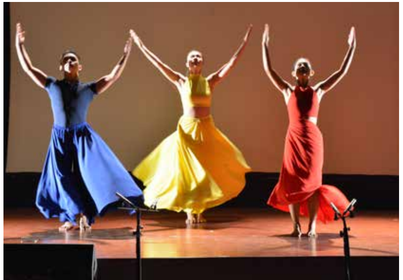
Ang UP Dance Company at ang kanilang pagtatanghal ng “Bandila.”

Natatanging Pook. Samantala, ang hinirang na Natatanging Pook ay ang Hardin ng Doña Aurora.